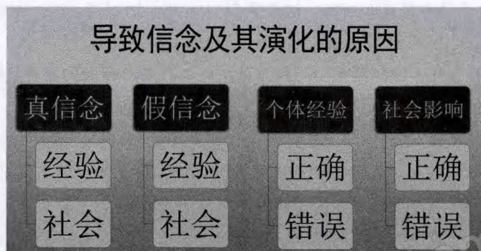
图 2 导致信念及其演化的原因

注:在 SSK 看来,信念的形成与演化都与一定自然因果过程有关。个体经验与社会因素均参与信念的形成与演化。真的信念与假的信念都同时与两种因素(经验与社会)有关,不能认定某一类因素导致真的信念,而另一类因素导致假的信念。导致某种信念的原因是一种混合物;经验因素或社会因素产生的结果也是一种混合物。